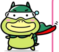
厚生労働省 公式キャラクター くたしかめたん>