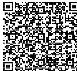
福岡労働局 「公正採用選考」

福岡労働局ホームページ「公正な採用選考・公正採用選考人権啓発推進員について」 https://jsite.mhlw.go.jp/fukuoka-roudoukyoku/hourei_seido_tetsuzuki/syokugyou_koyou/hourei_seido/taisaku_e01.html