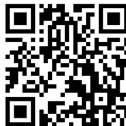
厚生労働省 「公正採用選考」 解説動画

厚生労働省においても「公正採用選考」解説動画がインターネット上で公開されています。 https://kouseisaiyou.mhlw.go.jp/video.html