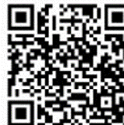
福岡県 「公正採用選考」

福岡県ホームページ「公正採用選考」 https://www.pref.fukuoka.lg.jp/contents/kouseisaiyou.html