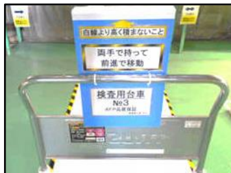
令和2年度の優良事例