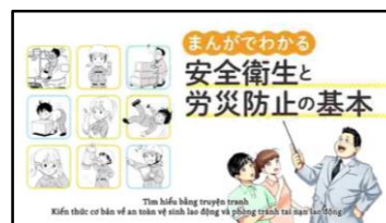
外国語教材(1/1か国語)