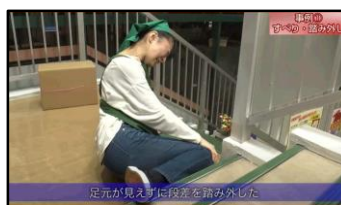
「転倒・腰痛防止用視聴覚教材」

安全衛生教育用の動画教材 を掲載しています。外国語版や作業別など、幅広い内容を用意しています。労働者向けの教育教材など、幅広くご活用いただけます。(出典を記載のうえ、適切にご利用ください。)