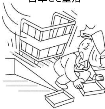
カゴ車が自走する