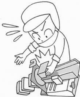
スライサーで切り傷