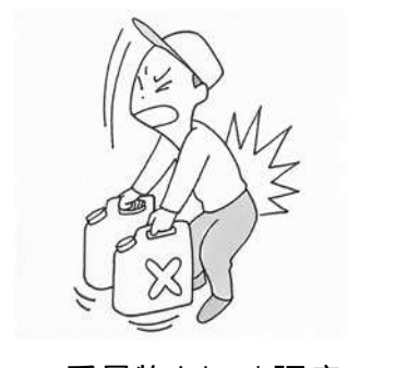
重量物をもつと腰痛