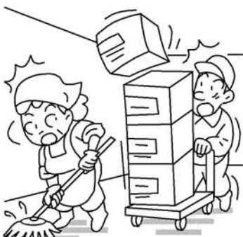
台車からものを落とす