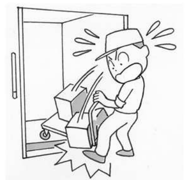
台車からものを落とす