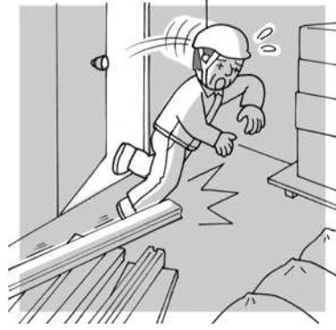
暗所でつまづいて転倒