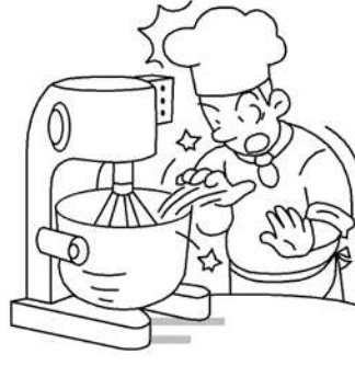
ミキサーに挟まれ