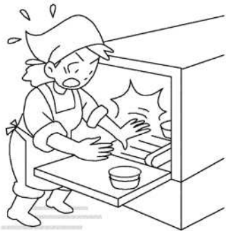
コンベア端部で挟まれ