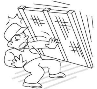
立てかけたものが倒れる