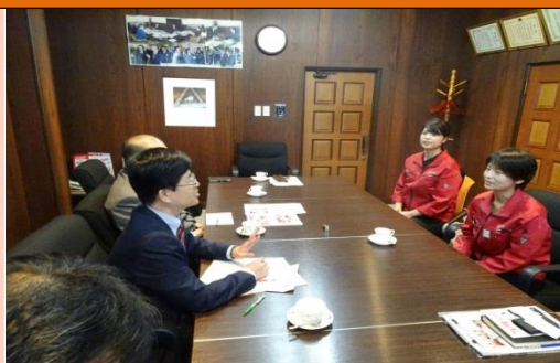
【2名の女性社員と意見交換する岩崎局長（左手前）】