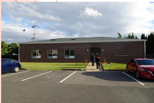
【タカハ・イノベーション・パーク（T. I. P）】