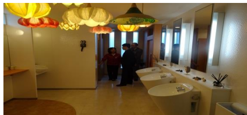
【インテリアにこだわったトイレ】