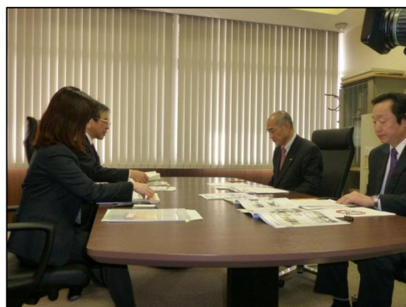
左から清水会長、中山専務理事

国土交通省自動車局では、トラック運送業界における女性の活躍を促進するため、女性トラックドライバーを「トラガール」と名付け、様々な取組を進めています