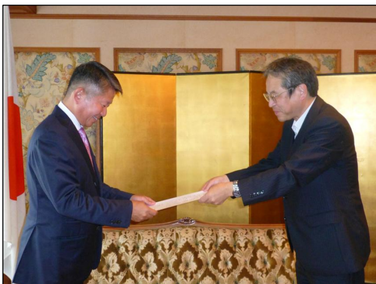
学校法人金井学園 金井理事長