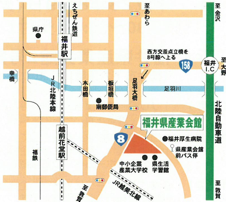
福井駅及び福井I.C.からのアクセス