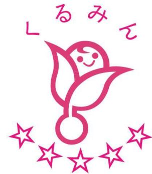
次世代認定マーク「くるみん」