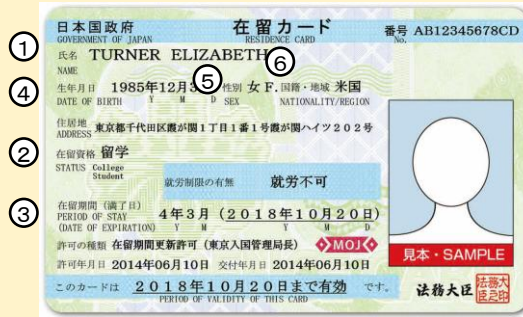
在留カード例（表面）