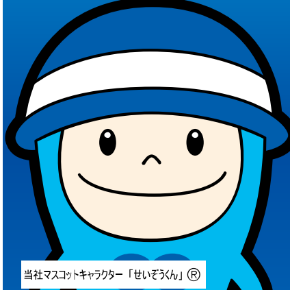
当社マスコットキャラクター「せいぞうくん」®

※上記以外にも各営業所・オフィスがございます。他拠点の詳細につきましては、裏面をご確認ください。