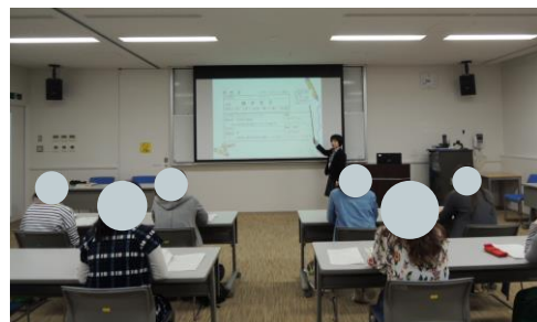
〈過去の開催の様子〉