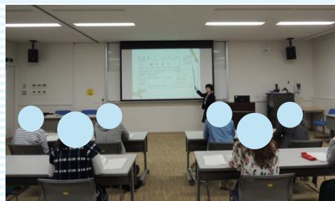
〈過去の開催の様子〉