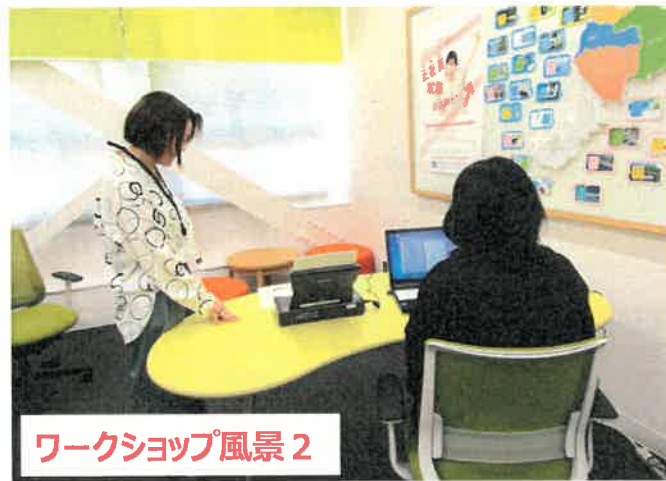
ワークショップ風景2