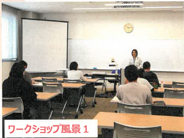
ワークショップ風景1

体験内容 ワークショップやCAD操作体験等をご用意しております。(1時間半程度)