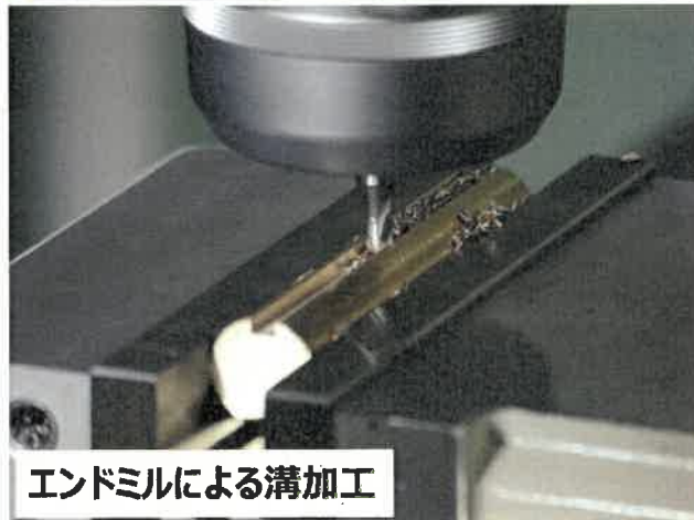
エンドミルによる溝加工