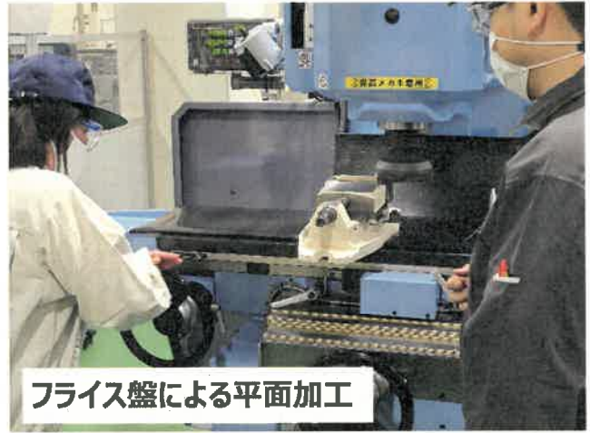
フライス盤による平面加工