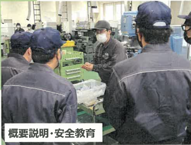
概要説明・安全教育