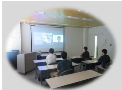
大型プロジェクターあり