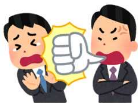
大勢の人の前で執拗に叱責された。

他にもハラスメントがあります。就業環境を害する言動がなされないように注意が必要です。