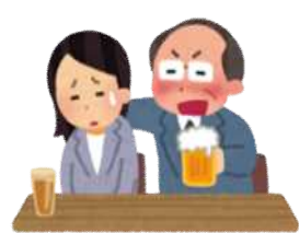
職場の宴会で体を触られた。 性的な話をされた。