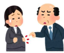
上司・同僚に「繁忙期に妊娠する なんて非常識だ」と言われた。