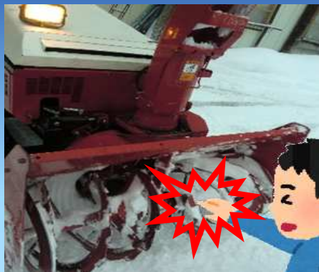
除雪機の回転部(オーガ)との接触