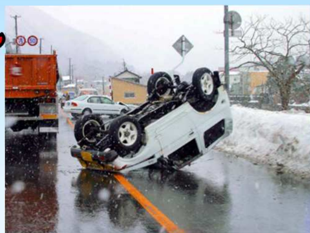
凍結路面での交通事故