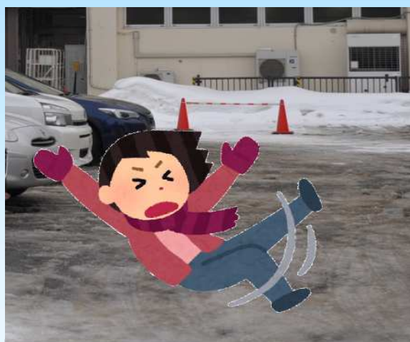
③凍結路面等での転倒