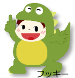
プッキー (ハローワーク福井公式キャラクター)

公的職業訓練を受講希望の方に受けていただく『訓練前キャリアコンサルティング』はご存知でしょうか？ キャリアコンサルティングではジョブ・カード作成を通して興味・適性・能力等を明確化したり、 職業経験の棚卸しを行うことで自己理解を深め、適切な訓練の選択を支援します！ ジョブ・カードを作成しておく、履歴書・職務経歴書の作成や面接でも役立ちます