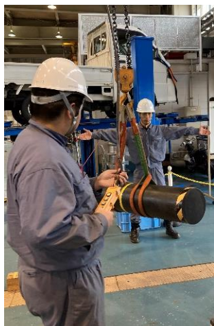
玉掛け・クレーン