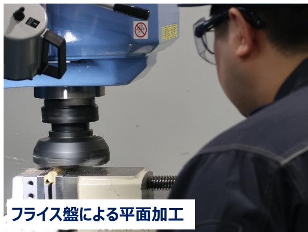
フライス盤による平面加工