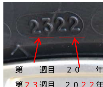
第 週目 20 年 第23週目 2022年 タイヤの製造年の見方

（プラットホーム）国内メーカー等の冬用タイヤでは、使用限度の目安として、溝の深さが新品時の50%まですり減った際にプラットホームが溝部分の表面に現れます。