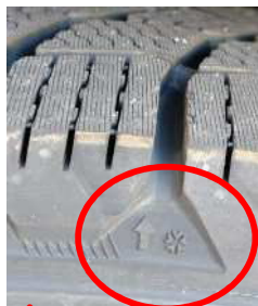
プラットホームのある場所を示した矢印

なお、スタッドレスタイヤの溝には、「スリップサイン」のほか滑り止め装置の限界を示すサイン（ プラットホーム ）がありますので、プラットホームが見えた際は、スタッドレスタイヤとしての性能が発揮できませんので交換が必要になります。