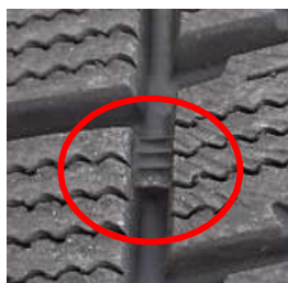
タイヤが擦り減って、プラットホームが露出した状態