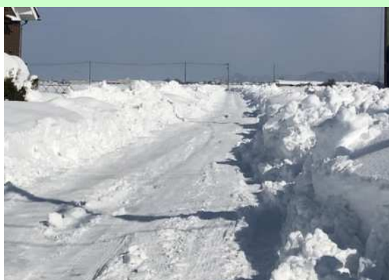
このような路面には注意が必要です。