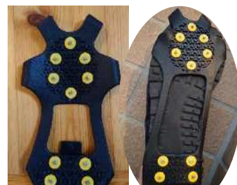
脱着可能な滑り止め