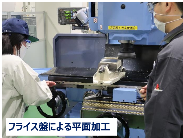
フライス盤による平面加工