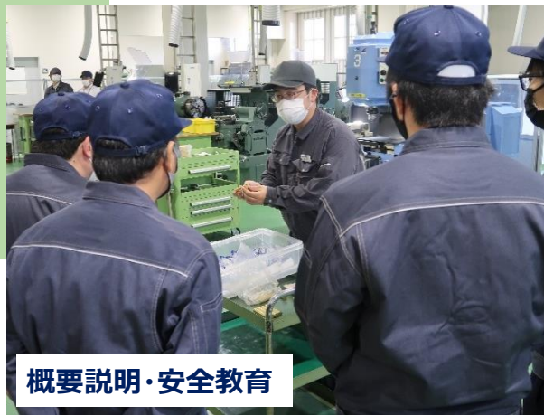
概要説明・安全教育

工作機械等による加工体験を通じ、 真鍮製の写真立てを完成させます（1時間半前後）