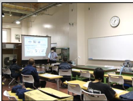
設備管理の仕事の魅力説明

電気・エアコン・水回り・消防・ボイラー設備の施工・設置・保守の仕事内容を実機を見ながらより詳しく知って頂き、設備管理の仕事の魅力を感じていただきます。(1時間半程度)