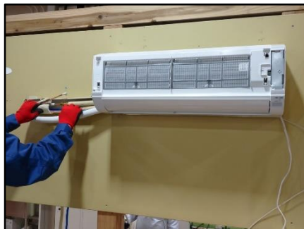
空調設備の訓練内容の説明