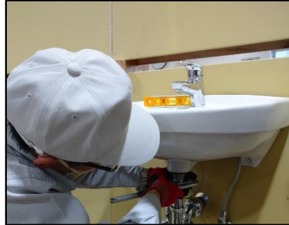
給排水設備の訓練内容の説明

体験会に参加すると 求職活動の実績 になります! 雇用保険受給資格者証をお持ちの方は 体験会当日ご持参下さい。