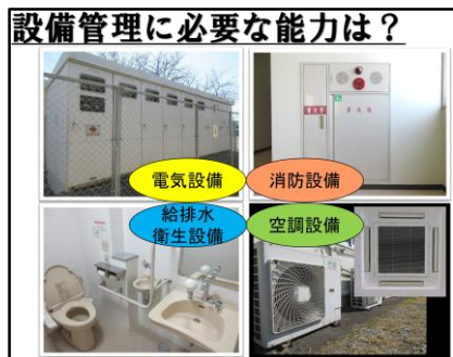
設備管理の仕事内容の説明