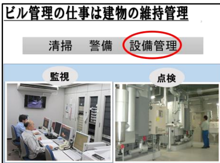
ビルメンテナンスの仕事内容の説明