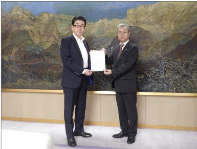
嶋田専務理事（左）に要請書をお渡しする石川労働局長（右）