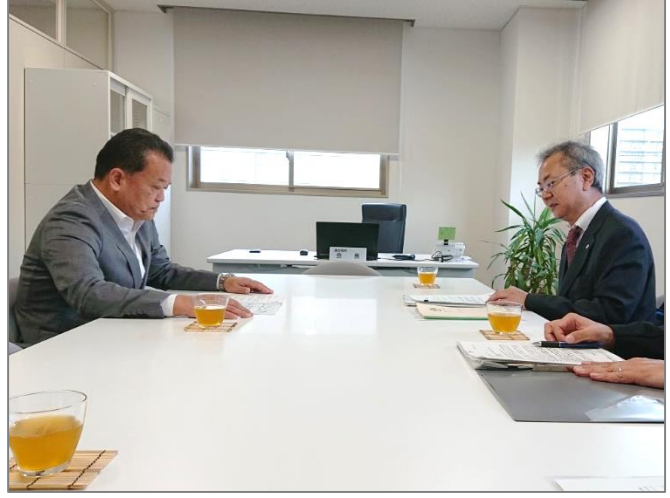
矢野会長（左）に要請書をお渡しする石川労働局長（右）