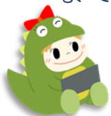
ハローワーク福井イメージキャラクター ハロハロ