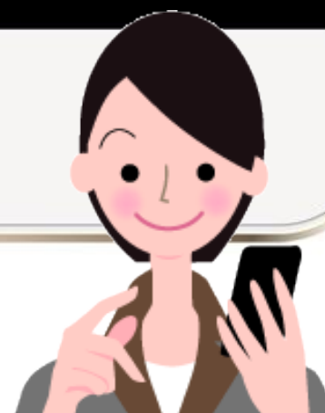
R6.8月 職種別求人・求職状況 【公表10/1】