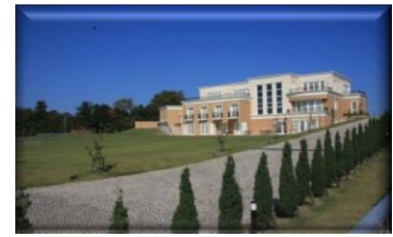
福井鋳螺株式会社 FUKUI BYORA Co., Ltd.