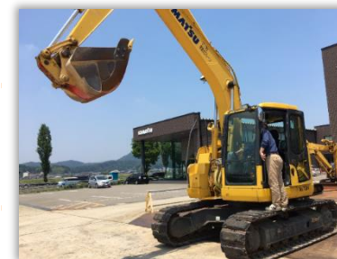
【重機メーカーにて】 操作方法・点検項目を確認

A なんとなく公務員を志望していた中、自分の専攻学問であった法律を活かせること、デスクワークだけではなく外に出て仕事ができることから労働局（監督官）を志望しました。