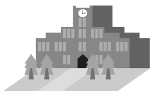
大学等 キャリアセンター