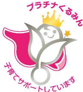
プラチナくるみんマーク