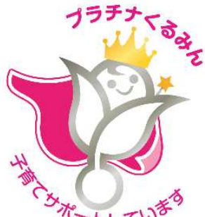
プラチナくるみんマーク