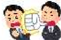
大勢の人の前で執拗に叱責された。