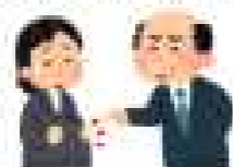
上司・同僚に「繁忙期に妊娠するなんて非常識だ」と言われた。