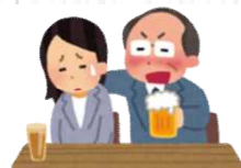
職場の宴会で体を触られた。 性的な話をされた。

他にもハラスメントがあります。就業環境を害する言動がなされないように注意が必要です。