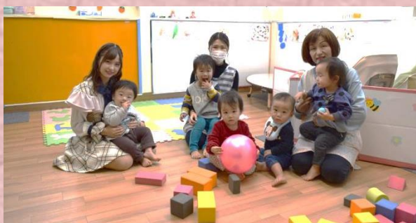
* 託児施設見学 *

次に、ハロートレーニング実施施設内にある無料託児所を見学し、受講者の方が訓練を受講している間に預けられている子どもたちと楽しい時間を過ごされました。