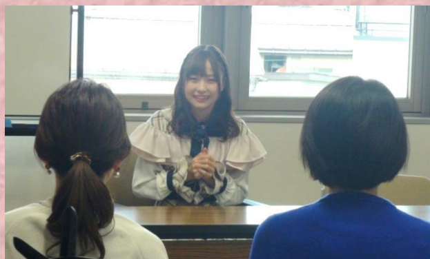
* 意見交換会 *