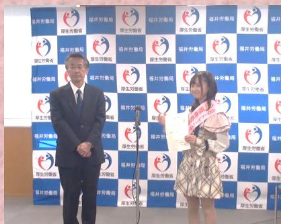
* 辞令交付 *