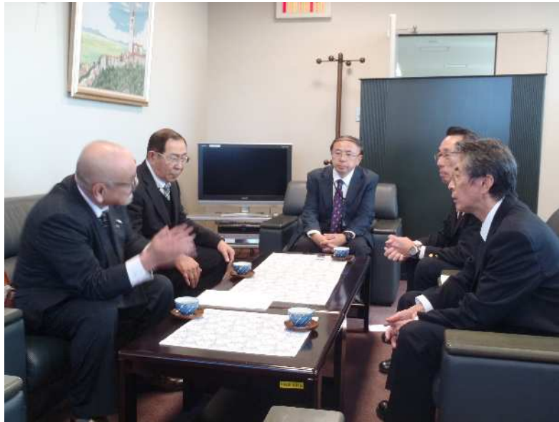
建設業における労働災害防止の取組を説明する 建設業労働災害防止協会 福井県支部長（左手前） 建設業労働災害防止協会 福井県支部 事務局長（左奥） 労働災害防止の取組の説明を聞く 福井労働局長（右手前） 福井労働局労働基準部長（中央奥） 福井労働局労働基準部健康安全課長（右奥）