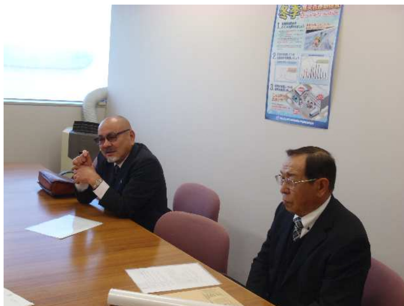
取材に対して県内の建設業の現状や労働災害防止の取組を説明する 建設業労働災害防止協会 福井県支部長（左奥） 建設業労働災害防止協会 福井県支部 事務局長（右）