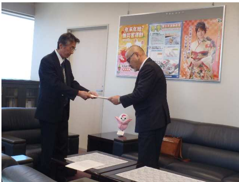
建設業労働災害防止協会 福井県支部長（右）への要請