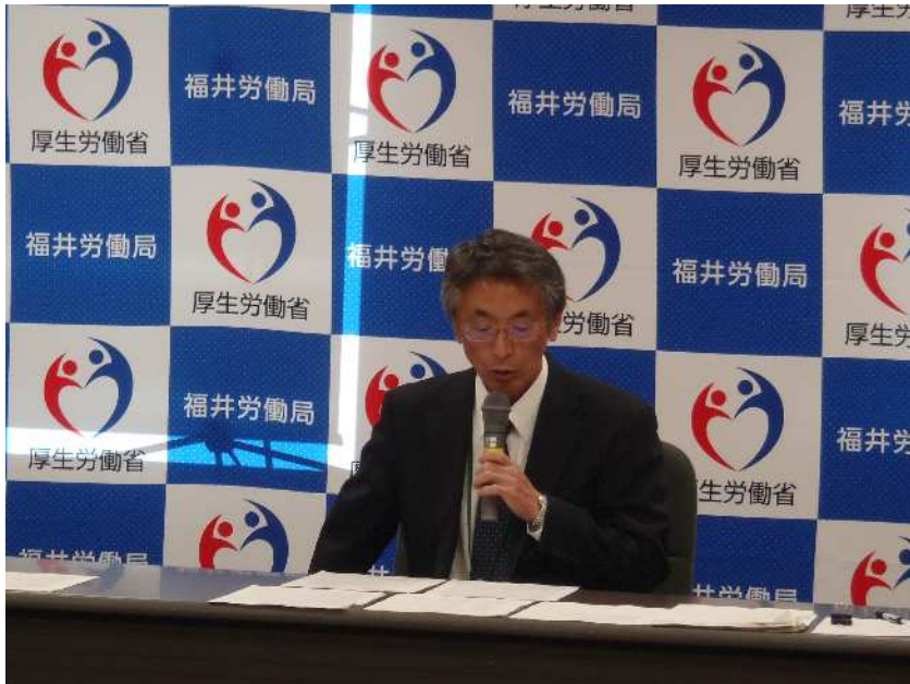
要請に先立ち、労働災害防止緊急対策強化期間の実施を 定例記者発表で説明する福井労働局長