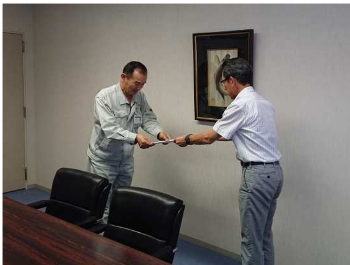
港湾貨物運送事業労働災害防止協会 日本海総支部山陰支部敦賀港分会長（左）への要請