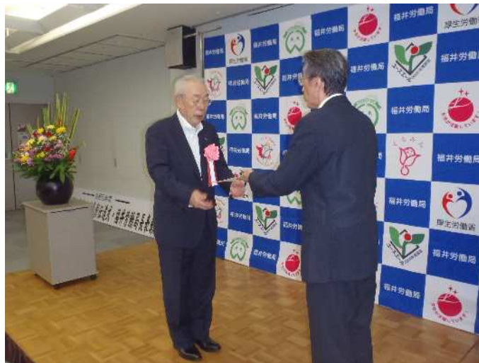
公益社団法人福井県労働基準協会 会長（左）への要請