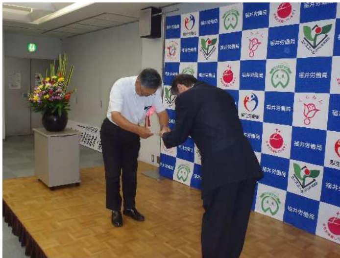
林業・木材製造業労働災害防止協会 福井県支部 副支部長（左）への要請