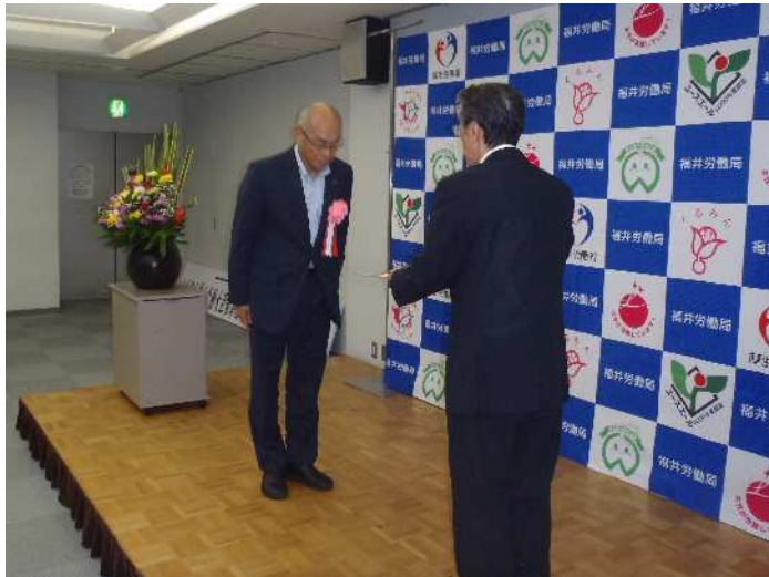
陸上貨物運送事業労働災害防止協会 福井県支部長（左）への要請