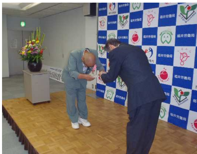
建設業労働災害防止協会 福井県支部長（左）への要請