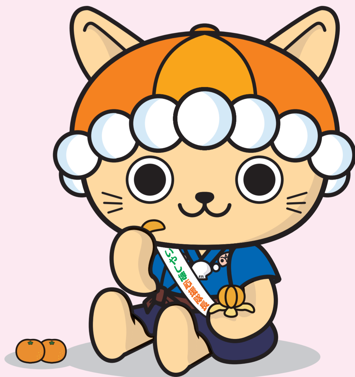
えひめ南予観光PRキャラクターにゃんよ