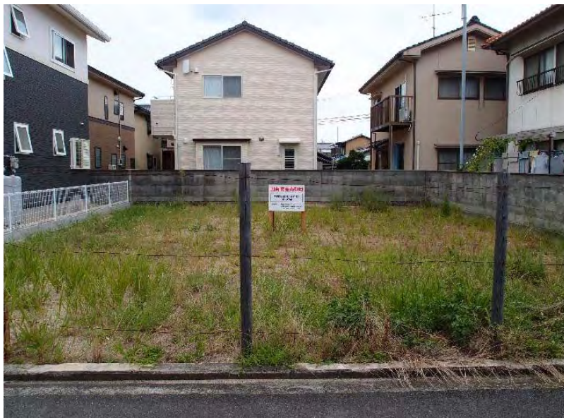
敷地東側より撮影