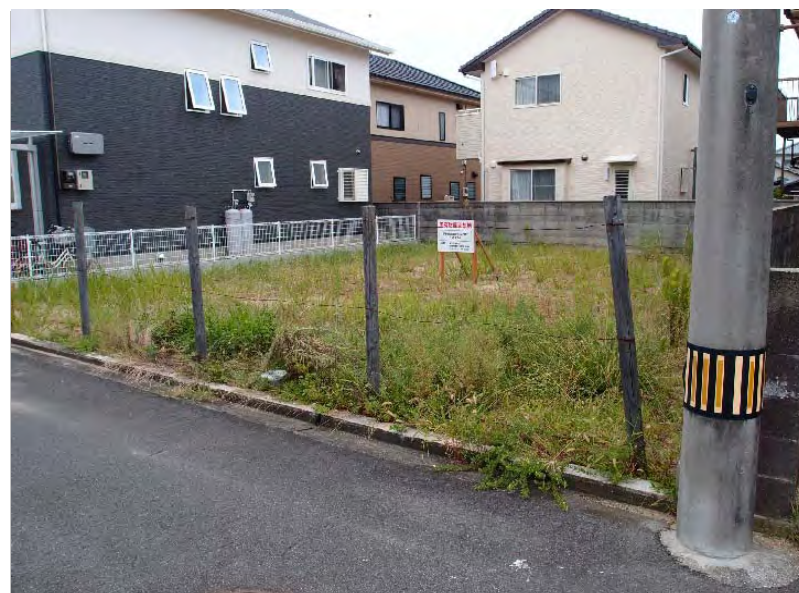
敷地北東側より撮影