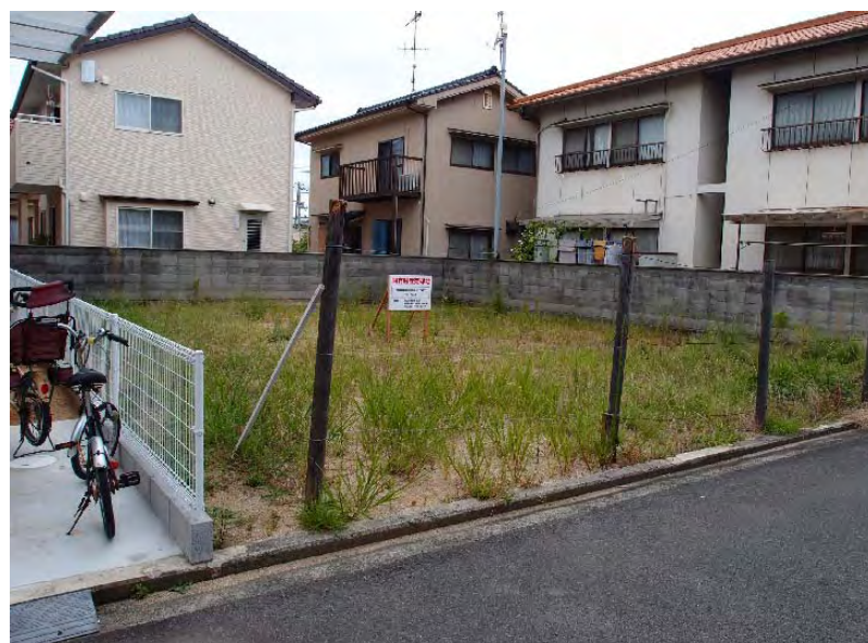
敷地南東側より撮影