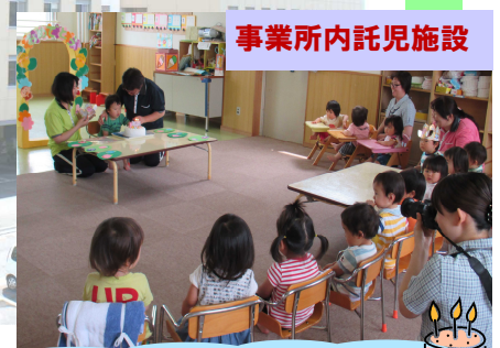
事業所内託児施設