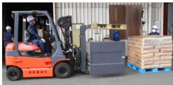
【パレットの積み替え作業】

バラ卸しの納品先の荷受人に対し、ドライバー自ら直接交渉し、納品時に次回納品用のパレットを借り受けたり、自社でパレットを用意することを実現しています。その結果、倉庫担当者が発送日前日に特殊なアタッチメントを付けたフォークリフトなどを使用してパレットの入れ替え作業が行えるようになり、ドライバーの手荷役作業を解消しています。