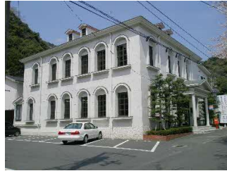
サンリード本社 外観写真