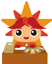
オフィスアシスタント