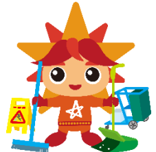
ビルクリーニング