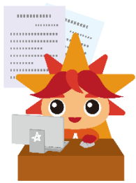
ワード・プロセッサ