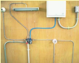
▲ケーブル配線工事