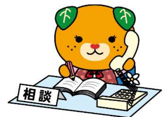
愛媛県イメージアップキャラクター 「みきゃん」 許諾番号：1-2612012