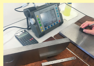
▲溶接部の超音波探傷試験