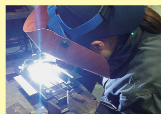
▲ステンレスの溶接