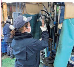
ヨシモト産業株式会社 Kさん