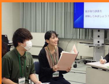
関係者への聴き取り調査