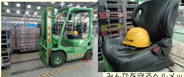
みんなを守るヘルメット