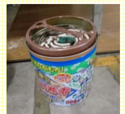
蚊からもきっちり守るよ