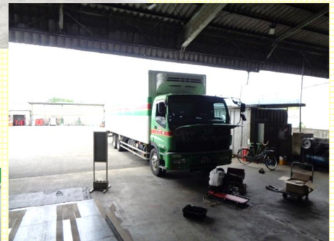
支店内に整備士さんいるよ すぐに直せるから安心だね