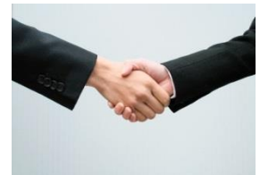
求職者と企業の 架け橋になります