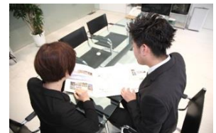
希望をじっくりききながら、 一緒に仕事を探していきます