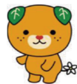
愛媛県イメージアップキャラクター みきやん

問合せ先 愛媛県教育委員会 特別支援教育課 松山市一番町4丁目4番地2 TEL 089-912-2967