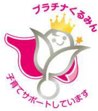
【プラチナくるみん】